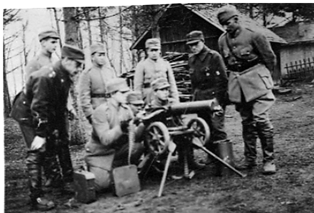
Vaskelan suojeluskuntalaisia konekivääriharjoituksissa